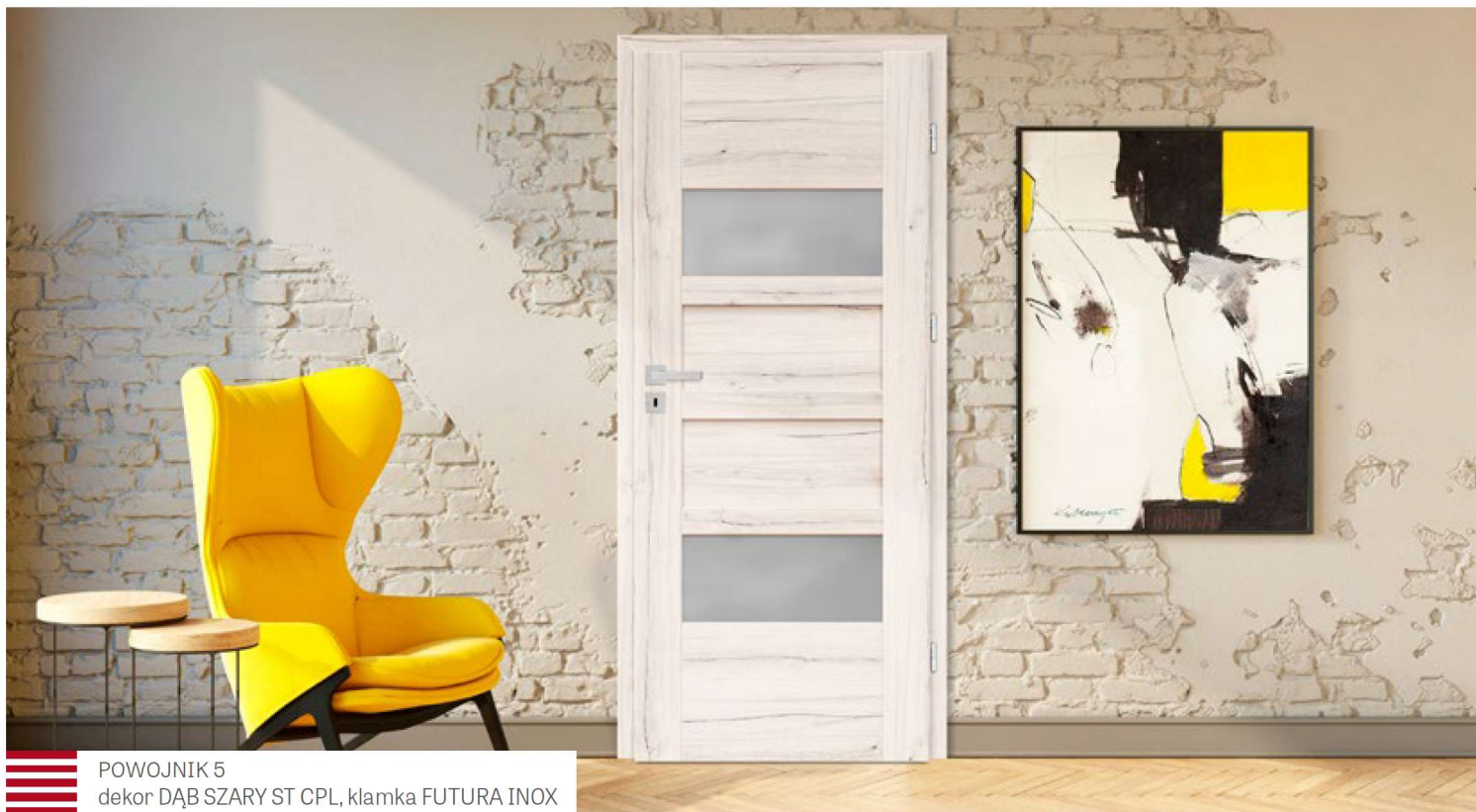
POWOJNIK 5 dekor DĄB SZARY ST CPL, klamka FUTURA INOX

SKRZYDŁA DRZWIOWE WEWNĄTRZLOKALOWE RAMIAKOWE STILE PRZYLGOWE I BEZPRZYLGOWE